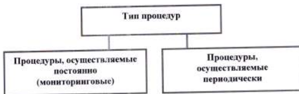
Рисунок 1. Типы процедур оценки качества дошкольного образования (РСОКДО ЯО).

К процедурам, носящим постоянный (непрерывный) характер, относятся мониторинговые исследования различного уровня, в том числе исследования качества образовательных программ; кадровой политики; условий для реализации ООП, АООП; условий взаимодействия с родителями воспитанников (содержание работы; удовлетворённость родителей качеством оказываемых ДОО услуг) не реже одного раза в год.